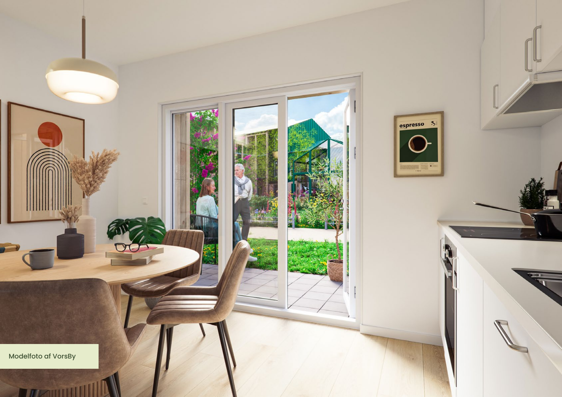
Modelfoto af VorsBy