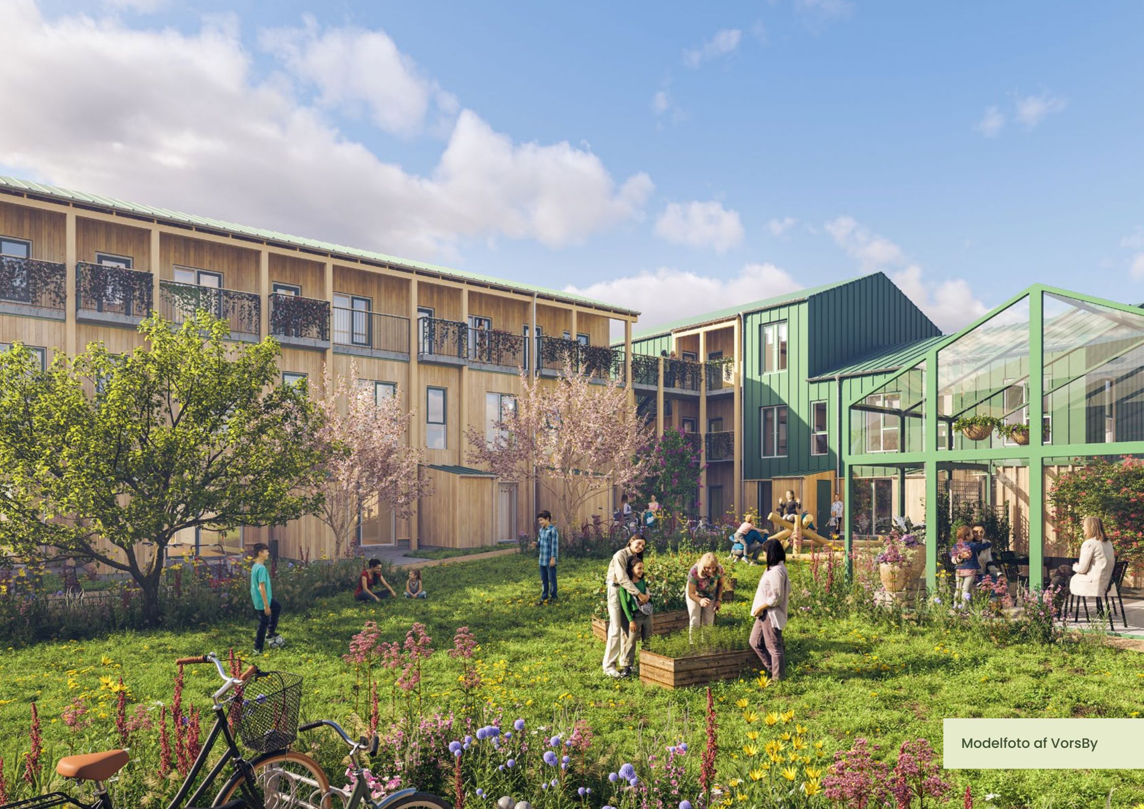
Modelfoto af VorsBy