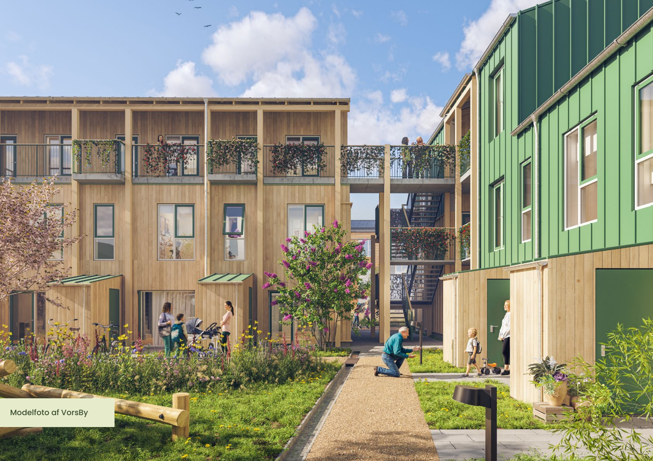
Modelfoto af VorsBy