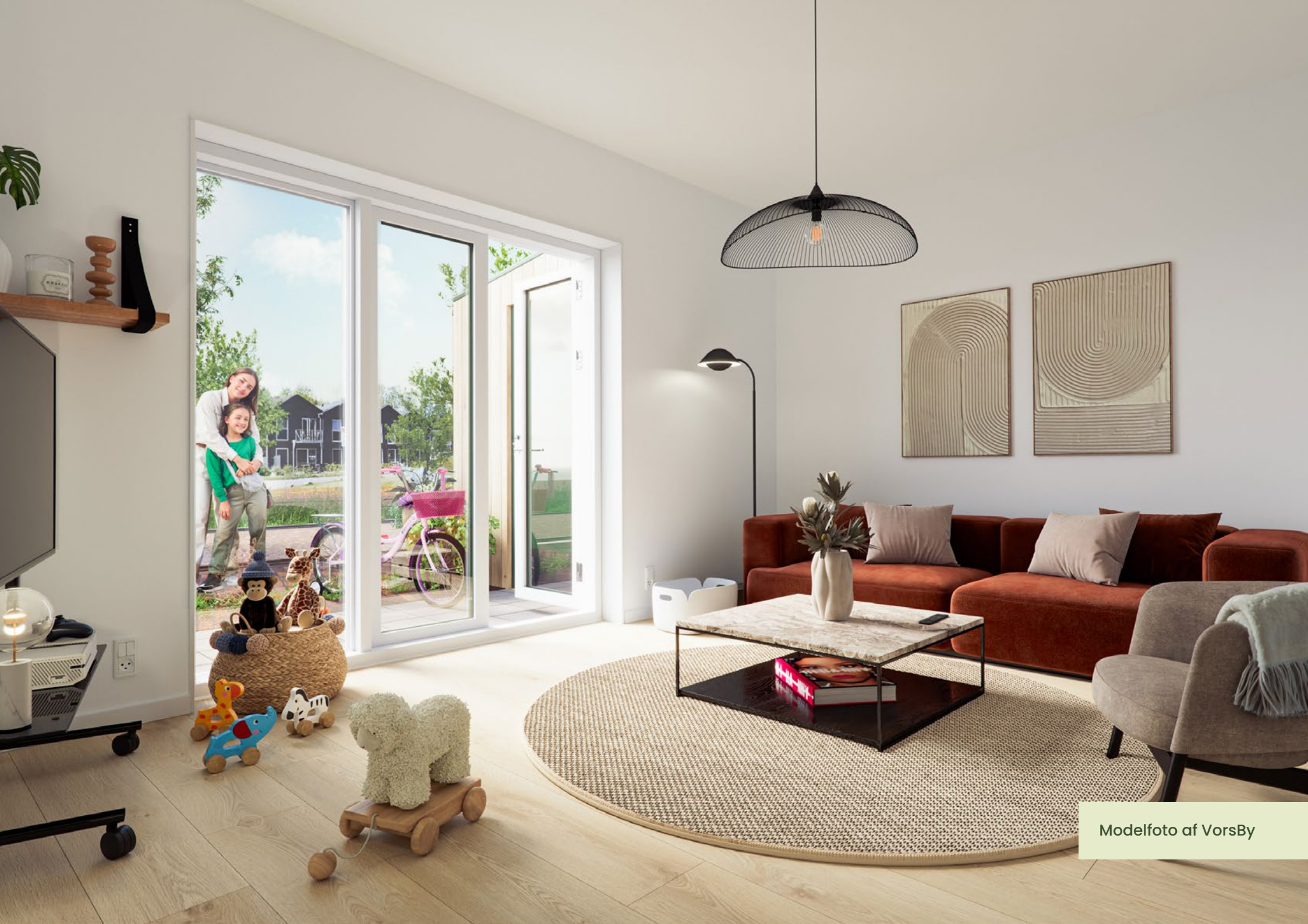
Modelfoto af VorsBy