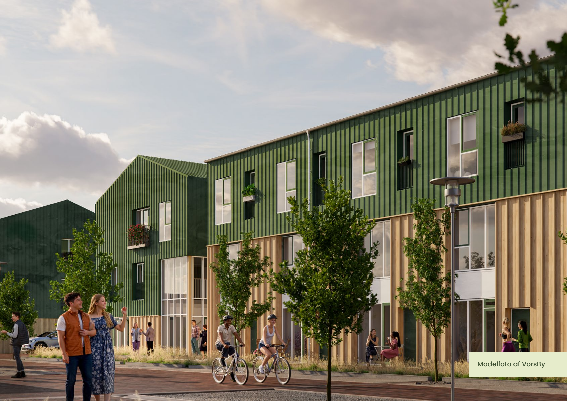
Modelfoto af VorsBy